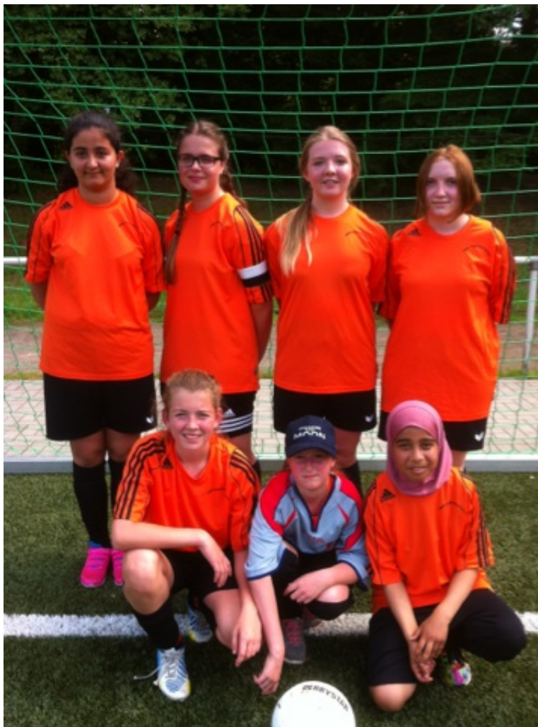
Das Team der HBG.