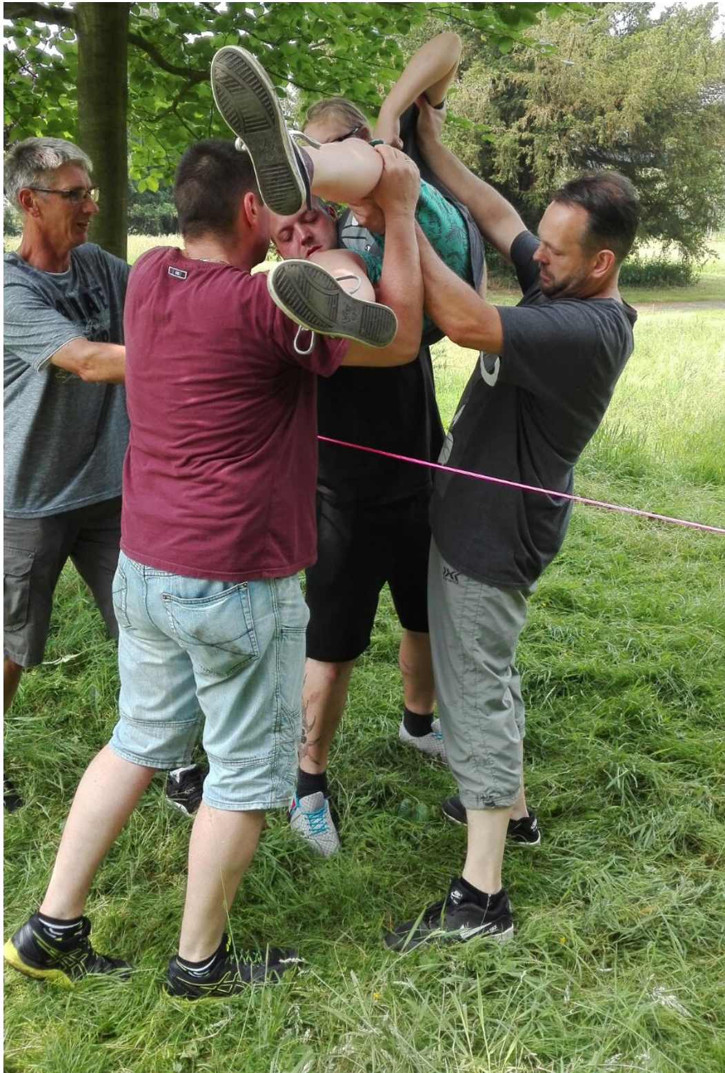
Impressionen von ...