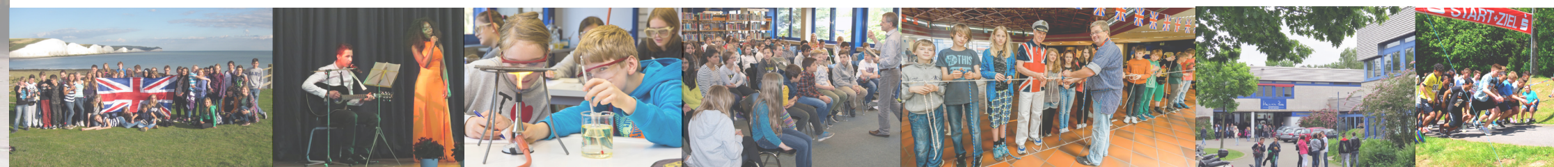
(c) Schütze/RN - wir bedanken uns bei den Ruhrnachrichten für die Bereitstellung einiger Fotos.

DAS ANMELDEVERFAHREN 2022 Eltern, die ihr Kind an einer Dortmunder Gesamtschule anmelden wollen, kommen persönlich mit ihrem Kind in die Schule ihrer Wahl und bringen den Anmeldebogen der Stadt und das letzte Halbjahreszeugnis mit. Ihnen und Ihrem Kind wird ein Mitglied der Schulleitung zu einem Gespräch zur Verfügung stehen. Die Anmeldetermine für die Gesamtschulen in Dortmund sind vom 28.01.-03.02.2022 . Bitte beachten Sie die tagesaktuellen Informationen auf unserer Homepage. Heinrich-Böll-Gesamtschule Volksgartenstraße 19, 44388 Dortmund Telefon 0231/696010, Telefax 0231/6960155 heinrich-boell-gesamtschule@stadtdo.de www.hbgdo.de